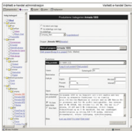
Administrationsværktøj (Figur 1)

Tag kontakt med os pr. telefon eller e-mail for et uforpligtende tilbud.